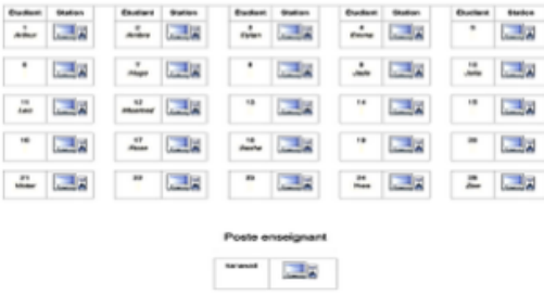
Fig. 2. Mariotel : Salle de TP